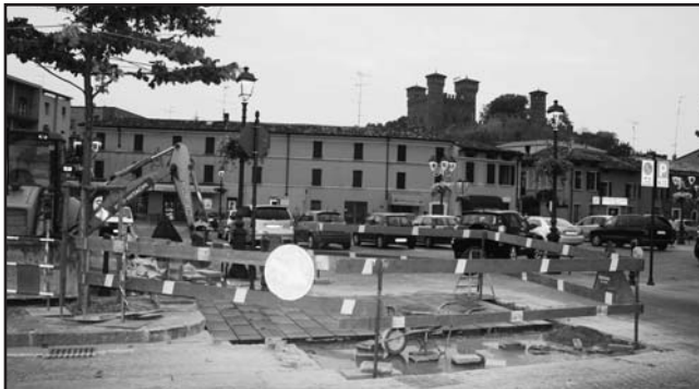
Lavori di ripristino in Piazza Treccani.

In diversi punti i cubetti in porfido iniziano a muoversi e fra