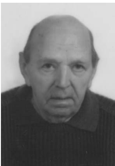
Luigi Treccani 6° anniversario