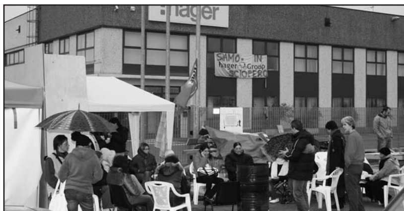
Il presidio degli operai davanti alla fabbrica.

I prodotti del gruppo Hager sono costituiti da una garanzia di particolari per la distribuzione di energia elettrica, sia in campo industriale che civile (placche, interruttori, ecc...), questi ultimi, per il mercato europeo, prodotti dal sito di Montichiari a Fascia d'Oro. Il paradosso è che mentre in Italia si