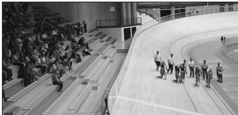
La prima gara ufficiale al velodromo.